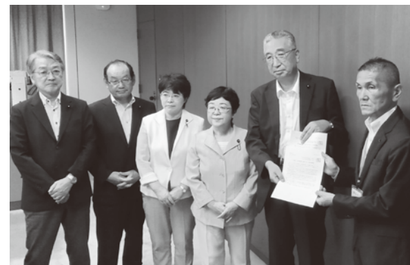
「宿泊税導入提案の撤回」および「物価高騰・猛暑・コロナ禍から命と暮らしを守る緊急要望」の申し入れ(2024年8月21日)