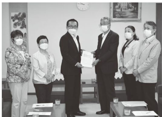
9月6日 統一協会問題で議長に申し入れ